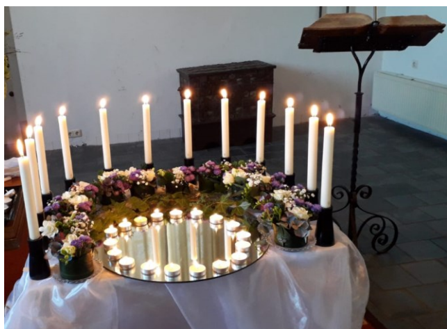
Laatste zondag kerkelijk jaar 2021

Na afloop van de dienst is er gelegenheid om koffie te drinken en na te praten.