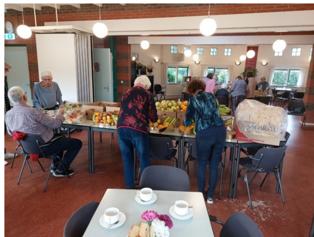
Vele handen maken licht werk

De opbrengst van de bakjes is voor ons project in Colombia - Stichting Kleine Arbeider. Dit project is in samenwerking met de PG Dieren opgezet.