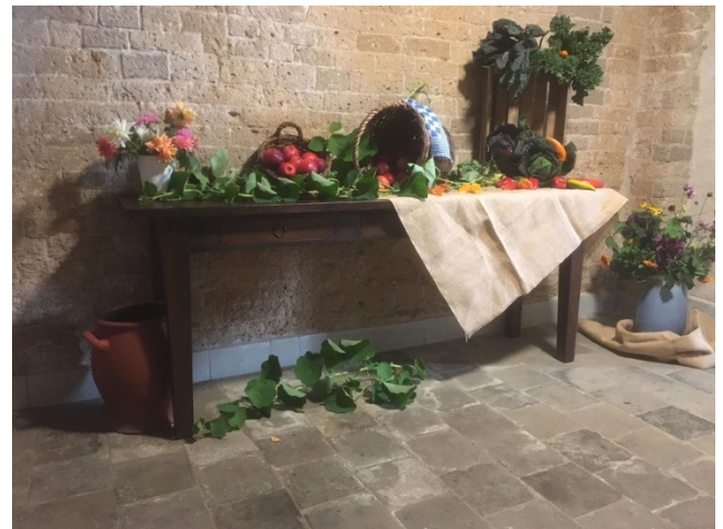
Liturgische schikking 13 november

In de kerk staan de vele fruitbakjes die speciaal gemaakt zijn voor deze dienst. De liturgische bloemschikgroep heeft de kerk weer prachtig aangekleed met bloemen, fruit, groentes etc. In de hal staat o.a. onderstaande schikking. Na afloop van de dienst mag u fruit en groente van de tafel in de hal meenemen. Wij wensen elkaar een gezegende en inspirerende dienst toe.